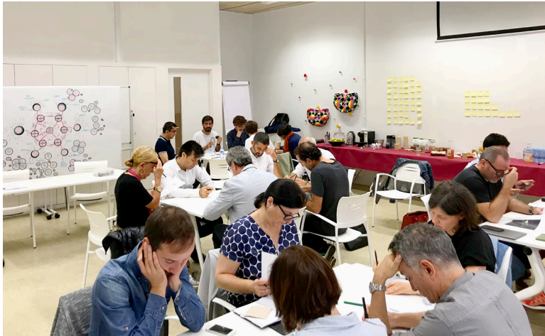
Deflexor Map Workshop

necesidades y deseos del cliente, tanto actuales como anticipados. La innovación orientada por el diseño y las macro-tendencias puede ser una herramienta más efectiva para que la inteligencia colectiva en insights de futuros usuarios sea más comprensible.